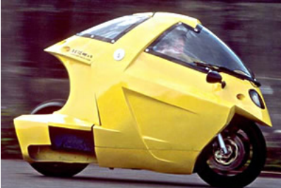
Conception de carrosseries protectrices pour véhicule deux-roues.