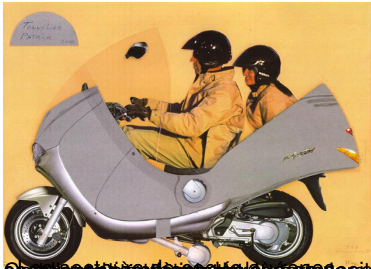
Le 1 er secteur de rotation du carrossage est légèrement haussé